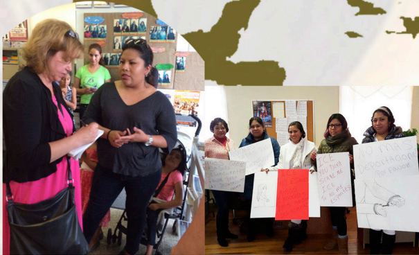
Abogando por DAPA y Ciudades Seguras (Sanctuary cities)

La Mujer Latina Inmigrante hoy en día, no solo es la cabeza de la casa, si no también, es la fuerza #1 de la economía de EE.UU. La mujer es identificada como el ser más influyente de nuestra próxima generación. Involucrándola en el activismo creará un enorme cambio social, y romperá con las barreras culturales y sociales que todavía existen, especialmente en Long Island.