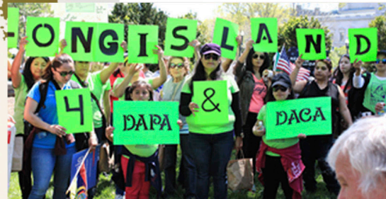
Action in Washington D.C for SCOTUS Decision on Extended DACA and DAPA

By active participation since 1993, we have directly & indirectly impacted the lives of Latina Women as individuals and also the view our communities have on Active Latina women. Latinas are quickly becoming one of the most active members of society and one the most participating and vocal community members. There is still more work to do to reach women who continue to feel disenfranchised and voiceless.