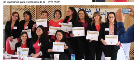
SEPA Mujer INC, 185 Oval Drive, Islandia, NY 11749 / Tel: (631) 980-2555 Services for the Advancement of Women. Servicios para el Avance de la Mujer. www.sepamujer.org