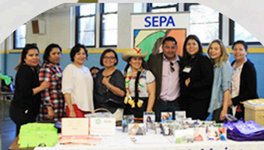
Justice for Farmworkers Campaign