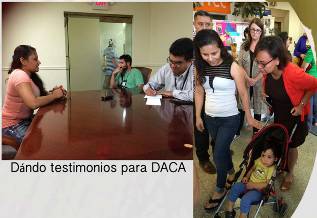
Dando testimonios para DACA