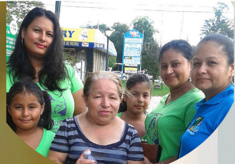
Apoyando la Union para los que usan Transportación Pública