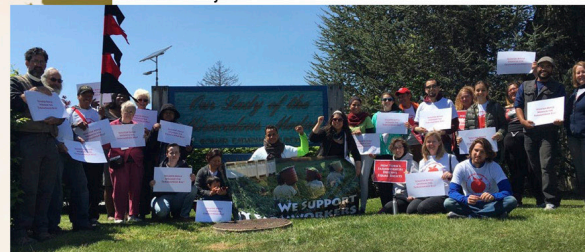
Apoyando la Marcha de 15 Dias para Derechos Laborales de Agricultores.

SEPA Mujeres luchan a ser el representante y voz para todos aquellos que han sido víctimas de la delincuencia y abogar para poner fin al temor que nuestra comunidad tiene a denunciar estos delitos para el progreso de nuestra comunidad, y por el bienestar de nuestros hijos .