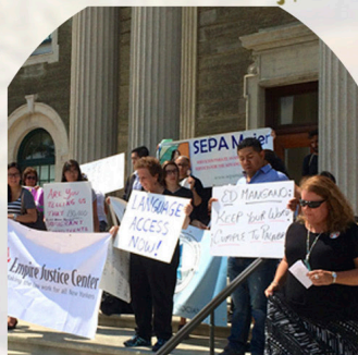
Language Access Campaigns 2016

The Latina Immigrant woman is not only the modern day bread winner or the head of household, she is now the driving force of today's economy and our next generation's biggest role model. Getting her involved in social justice actions will create a huge shift in our social norms, and will break down the cultural and social barriers that continue to exist today especially in Long Island.