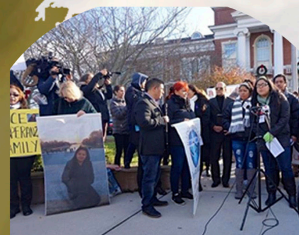
Advocating to end Domestic Violence